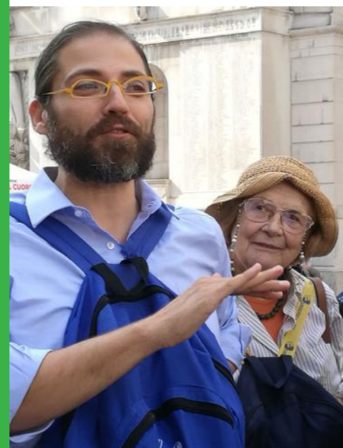
I soci di VerDiSegni "in azione"

ni e risorse saranno destinate alla tutela della biodiversità in quanto presupposto di base per il mantenimento degli equilibri di tutti gli ecosistemi e quindi per la continuazione della vita sulla Terra. Nell'ottica di queste implementazioni va ricordato che tutti, nessuno escluso, siamo chiamati a tutelare la varietà