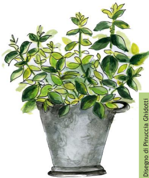
Disegno di Pinuccia Ghidotti

E pensava incredula e stupita alle altre piante, agli alberi che a lei sembravano davvero imponenti e si chiedeva quante specie di aceri, di acacie, di querce esistessero, magari così diverse fra loro da non essere riconoscibili e ringraziava Luca per la sua passione per la biodiversità che ora era diventata anche la sua.