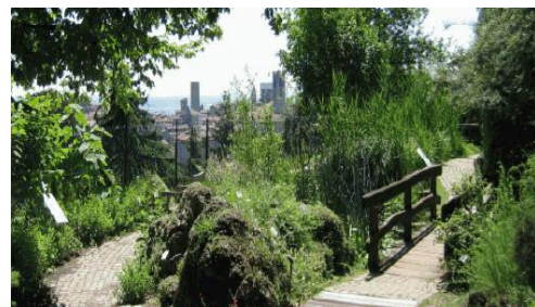
Valle della Biodiversità - Bergamo

è percepita dalle persone, il cui carattere deriva dall'azione di fattori naturali e/o umani e dalle loro interrelazioni".