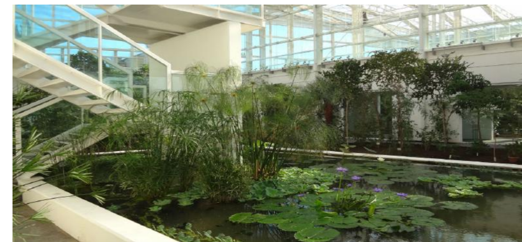
Le serre del Nuovo Orto Botanico

- Diversità genetica: l'insieme del patrimonio genetico degli esseri viventi. - Diversità di specie: l'insieme delle specie animali e vegetali.