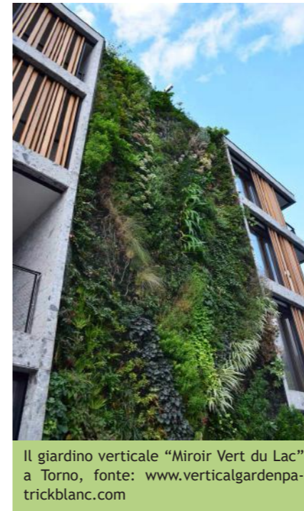
Il giardino verticale "Miroir Vert du Lac" a Torno, fonte: www.verticalgardenpatrickblanc.com

dall'interno dell'edificio. Tra le numerose realizzazioni sparse in tutti i continenti si ricorda anche il centro commerciale Siam Paragon, Bangkok, la facciata del centro culturale Caixa Forum di Madrid (figura a lato), un quadro vivente di più di 15.000 piante, il tappeto verde della Hong Kong Polytechnic University, la foresta verticale del Pont Juvenal di Aix-en-Provence, l'hotel Athenaeum di Londra (12.000 piante di 260 specie che colonizzano 8 piani). Nel corso della manifestazione, Patrick Blanc ha presentato le ultime realizzazioni anche negli ambiti più difficili e complessi come quelli mediterranei o mediorientali. Sono stati presentati i suoi progetti ecologici, veri e propri sistemi di filtraggio e condizionamento, creativi e benefici per la qualità dell'aria, realizzazioni di giardini e spazi verdi, capaci di rivoluzionare l'architettura moderna e del paesaggio, decorando proprietà private, musei, gallerie commerciali, alberghi ed edifici pubblici. Patrick Blanc in particolare ha illustrato uno dei suoi ultimi lavori nel nuovo hotel 5 stelle Il Sereno, che porta la firma della designer spagnola Patricia Urquiola e accoglie la cucina di Andrea Berton. Il progetto ver-