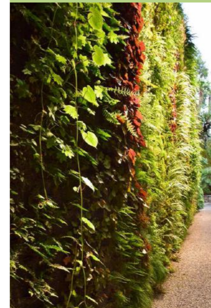
Dettaglio giardino verticale "Canyon" a Torno, fonte: www.verticalgardenpatrickblanc.com

de d'autore è di Patrick Blanc. L'Hotel Il Sereno, è situato a Torno sul lago di Como, nel luogo dove sorgeva il vecchio albergo Villa Flora di cui rimane solo il muraglione fronte lago. Da una parte una grande terrazza panoramica, dall'altra l'imbarcadero privato dove attraccano i motoscafi Riva, messi a disposizione dell'albergo. Trenta le suite, tutte con terrazza privata e vista lago. Di ispirazione lacustre anche il décor degli interni: alle tonalità calde della pietra e delle boiserie di noce si alternano note blu e verdi. «Il richiamo alla natura ha avuto un ruolo importante nel concept nell'hotel», ammette Urquiola. Per questo Urquiola ha chiamato il green designer Patrick Blanc a collaborare al progetto con le sue opere. E' così che il botanico francese ha creato tre pezzi d'arte vegetale, due giardini verticali e una scultura verde "Le Miroir Vert du Lac", "Le Canyon" e "Les Racines Echasses". Il Sereno, incastonato tra l'acqua e le montagne e circondato dal verde, appare oggi con una facciata di impatto, realizzata in pietra, legno e vetro, interrotta da un giardino verticale posto sul versante nord "Le Miroir Vert du Lac". Il giardino verticale di Blanc consta di quasi 2.000