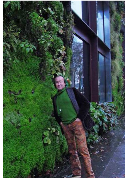
Patrick Blanc davanti alla facciata verde del Museo Quai du Branly

di Parigi, ma è sicuramente la facciata del Musée du Quai Branly a rappresentare il suo primo lavoro di fama mondiale, su architettura di Jean Nouvel. Negli anni ha perfezionato la sua idea grazie all'osservazione delle strategie di adattamento della vegetazione che prospera su alberi e rocce a sviluppo verticale (in assenza completa del terreno e in presenza di molta umidità), selezionando le piante in base alle caratteristiche climatiche del luogo, alla disponibilità di luce e alla capacità di radicare sui sistemi di inverdimento verticale. Blanc è sicuramente il precursore dei giardini verticali, ora realizzati da molti altri professionisti del settore, ma le sue realizzazioni si riconoscono per l'abbinamento di una forte